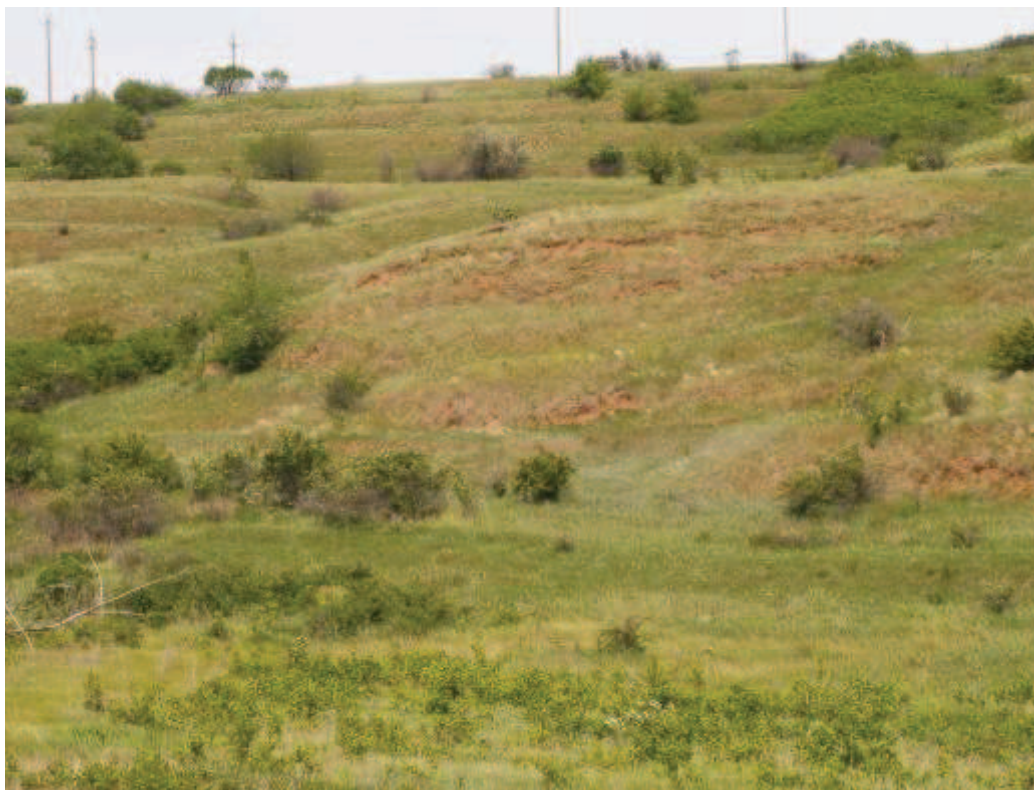
Рис. 2. Современные пластические деформации склона, сложенного скифскими красно-бурыми глинами

нах и по геоморфологии и геологическому строению близок описанному участку. Виноградарство здесь имеет долгую и успешную историю. Старое название хутора – Собачинский в 1905 г. было изменено на более благозвучное, основанное на фамилии казака Пухлякова, разводившего сорт винограда своего имени. Виноградники давали вина хорошего качества. В 1814 году по инициативе М.И. Платова здесь был организован «Образцовый винный подвал», а в 1905 году - Войсковая школа виноградарства и виноделия. Опыт виноградарства в таких сложных условиях необходимо использовать и в наше время.