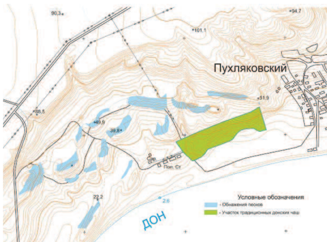
Рис. 4. Места выхода на поверхность склонов песков и терруар традиционных виноградников на донской чаше

Главную роль в формировании благоприятных гидрогеологических условий для виноградников играют выходы на поверхность склонов меотических песков, показанные на рисунке 4. Для терруара традиционных донских виноградников грунтовые воды подпитываются двумя выходами песка с восточной стороны участка. Остальные выходы песков поставляют грунтовые воды в замкнутое водоупорными слоями глин пространство, где они становятся высокоминерализованными – горько-соленными. Выходы песков с западной стороны подпитывали грунтовыми водами ещё один участок традиционных донских чаш, но в настоящее время он занят промышленным объектом – водоподъёмом для города Шахты.