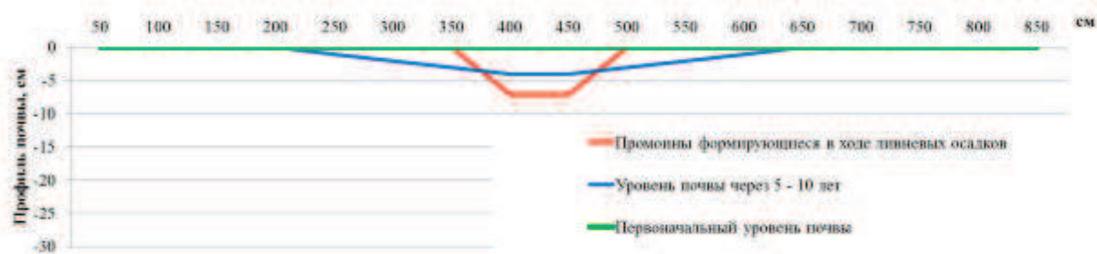
Рис. 1. Уровень почвы при развитии водной эрозии на поперечном профиле межклеточной дороги

Динамический процесс развития водной эрозии на виноградниках с горизонтальным расположением рядов представляется нам в следующем виде. Сплошной поток воды, возникающий при ливневых осадках, формирует по межклеточной дороге небольшую промоину 100 см в ширину и 7 см в глубину. В рядах таких промоин как правило не наблюдается, так как культивации формируют вал, а в междурядьях микро понижение, которое служит препятствием для движения водяного потока. Дальнейшие культивации заравнивают промоину в процессе сноса почвы из междурядья в межклеточную дорогу. Следующий сильный ливень приводит к формированию более глубокой и более широкой промоины. Процесс повторяется: культивациями промоины нивелируются – балка растет (рис. 1, 2).