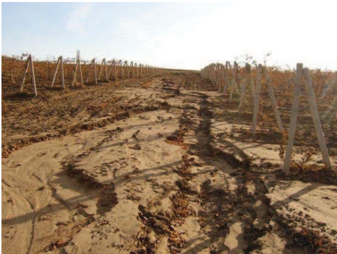
Рис. 3. Развитие эрозионных процессов почвы по межклеточным дорогам на виноградниках 2-4 год вегетации

связи целесообразно при возделывании виноградников использовать технику с пониженным удельным давлением на почву (гусеничные трактора, колесные трактора со специальными шинами пониженного давления).