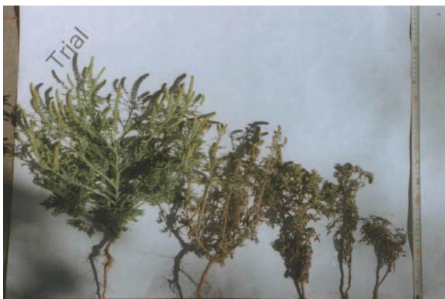
Рис. 2. Растения амброзии: слева – здоровое, справа – в различной степени поражённое сосудистым клещом