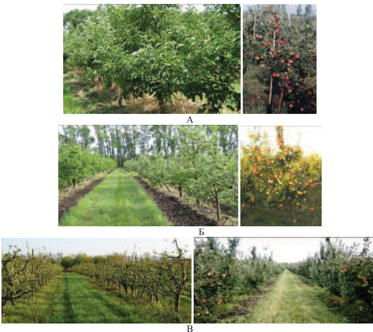
Рис. 1. Состояние и плодоношение насаждения яблони: А – 2004 г., Б – 2007 г., В – 2012 г.