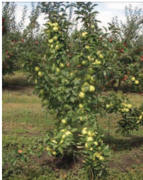
Марго (подвой СК 2, СПК «Де-Густо», 4 года)