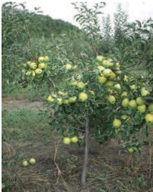
Марго (на СК 2, ООО «Интеринвест», 4 года)