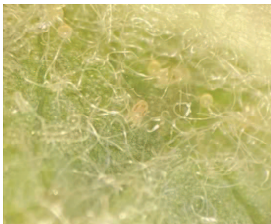
Рис. 2. Обыкновенный паутинный клещ ( Tetranychus urticae Koch.) (оригинал, 2021)

На 21-е сутки при нарастании численности имаго и личинок обыкновенного паутинного клеща в контрольном варианте до 4,1 особей на лист отмечено снижение эффективности до 87,8 % (Акардо, ККР) и 86,6 % (Оберон Рапид, КС).