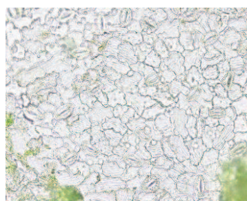
Иммунная форма – АИ5

Нами была продолжена работа по выявлению коррелятивных связей между морфологическими показателями листа и устойчивостью к коккомикозу форм рода Cerasus Mill. сильно восприимчивых, средне поражаемых и устойчивых к данному патогену (рис.).