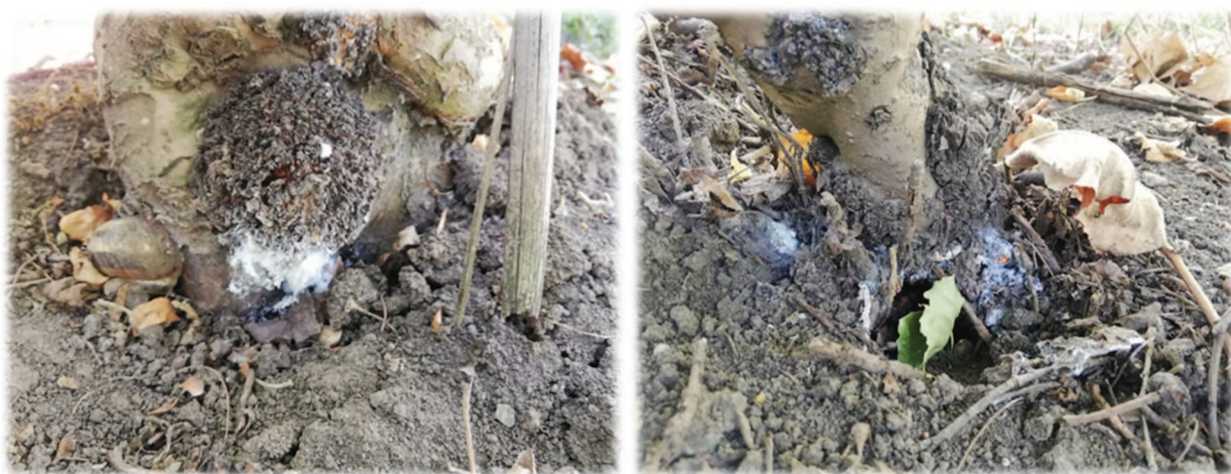
Рис. 2. Повреждения кровяной тлей ( Eriosoma lanigerum Hausmann)

Питаясь соком растений, тли вызывают на коре образования узловатых утолщений-желваков. Разрастаясь, желваки трескаются и образуют глубокие язвы, обмен веществ в тканях ухудшается, могут появиться вторичные вредители и возбудители болезней. (рис.2).