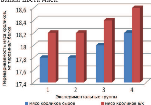
Рис. 1. Сравнительные данные по влиянию откорма на переваримость мяса кроликов (сырого и варено-копченого)

селена составило 89,69 мкг/кг. Полученные данные согласуются с результатами исследований цвета мяса.