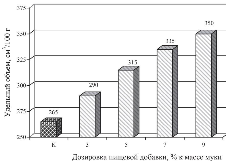
Рис.1. Влияние дозировки пищевой добавки «Порошок грушевый» на удельный объем хлебулочного изделия